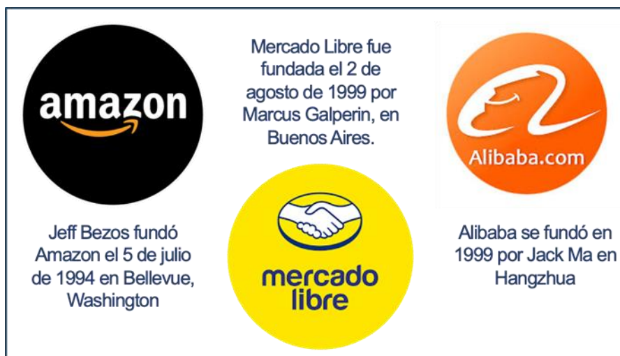
Gráfico 2. Principales empresas de mercado electrónico.