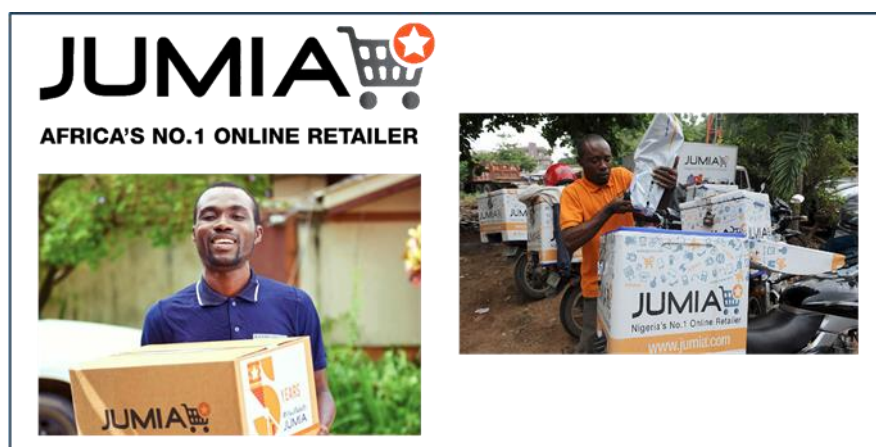
Gráfico 3. Amazon Africano: Jumia

Pero, estas empresas no deberían ser el centro de atención, el verdadero ejemplo de emprendimiento que se enfocó en cubrir las necesidades de la sociedad de un país a través de la innovación y la tecnología es el Amazon Africano.